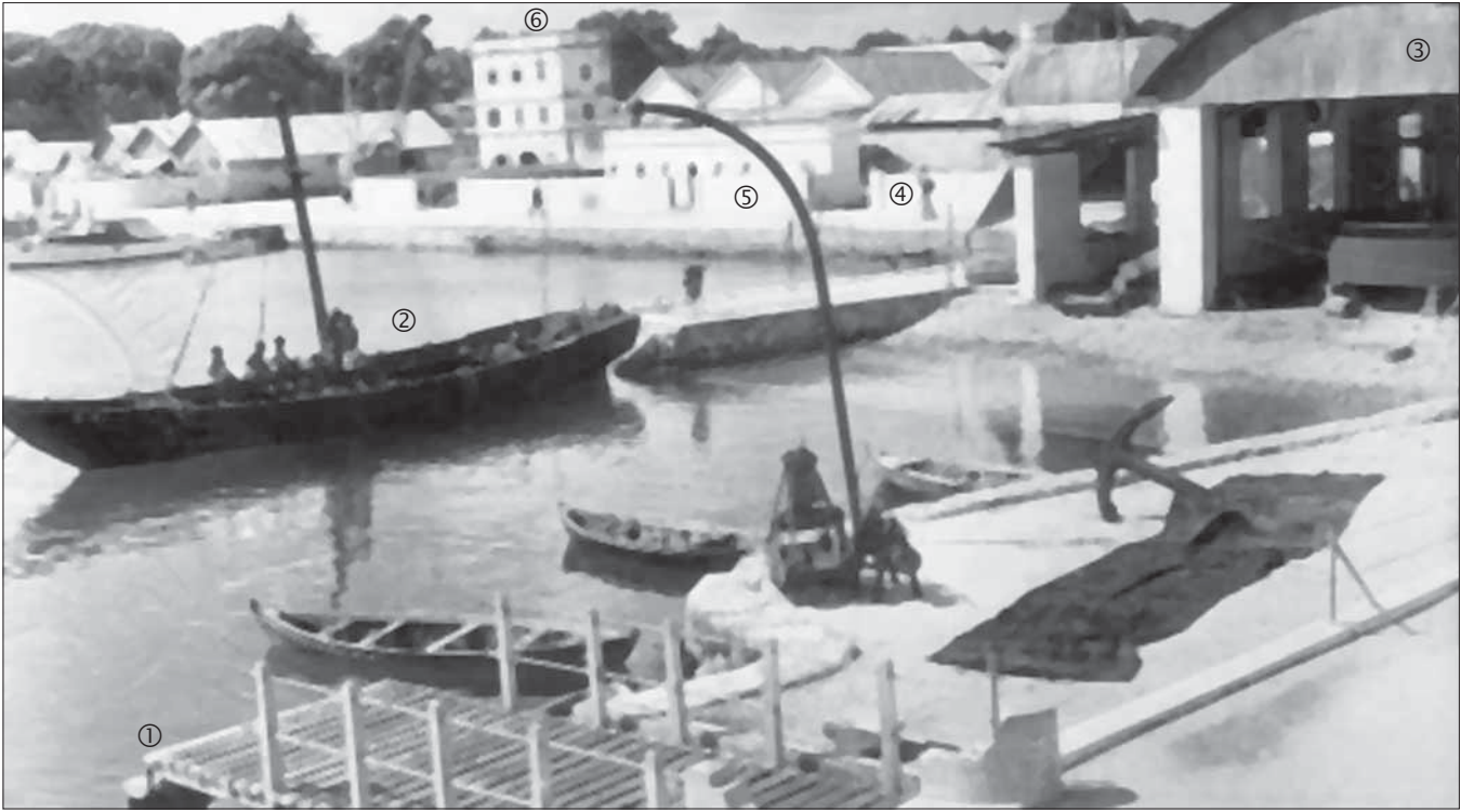
1- ޖަލްޖަލް ފަލްޖަލް 2- ޤިޔާމަތު ޖަލްޖަލް 3- ފަލްޖަލް ޖަލްޖަލް 4- ޖަލްޖަލް ޖަލްޖަލް 5- ޖަލްޖަލް ޖަލްޖަލް 6- ޖަލްޖަލް ޖަލްޖަލް