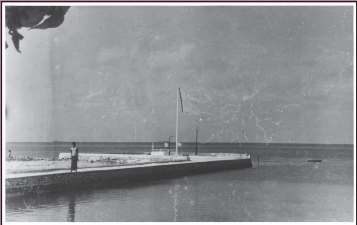
މަލެ ޤިސްމުގެ ސަރުކާރުގެ ޖަނަވަރު 1950 ގައި ހެދިފައިވާ ސަރުކާރުގެ ޖަނަވަރު