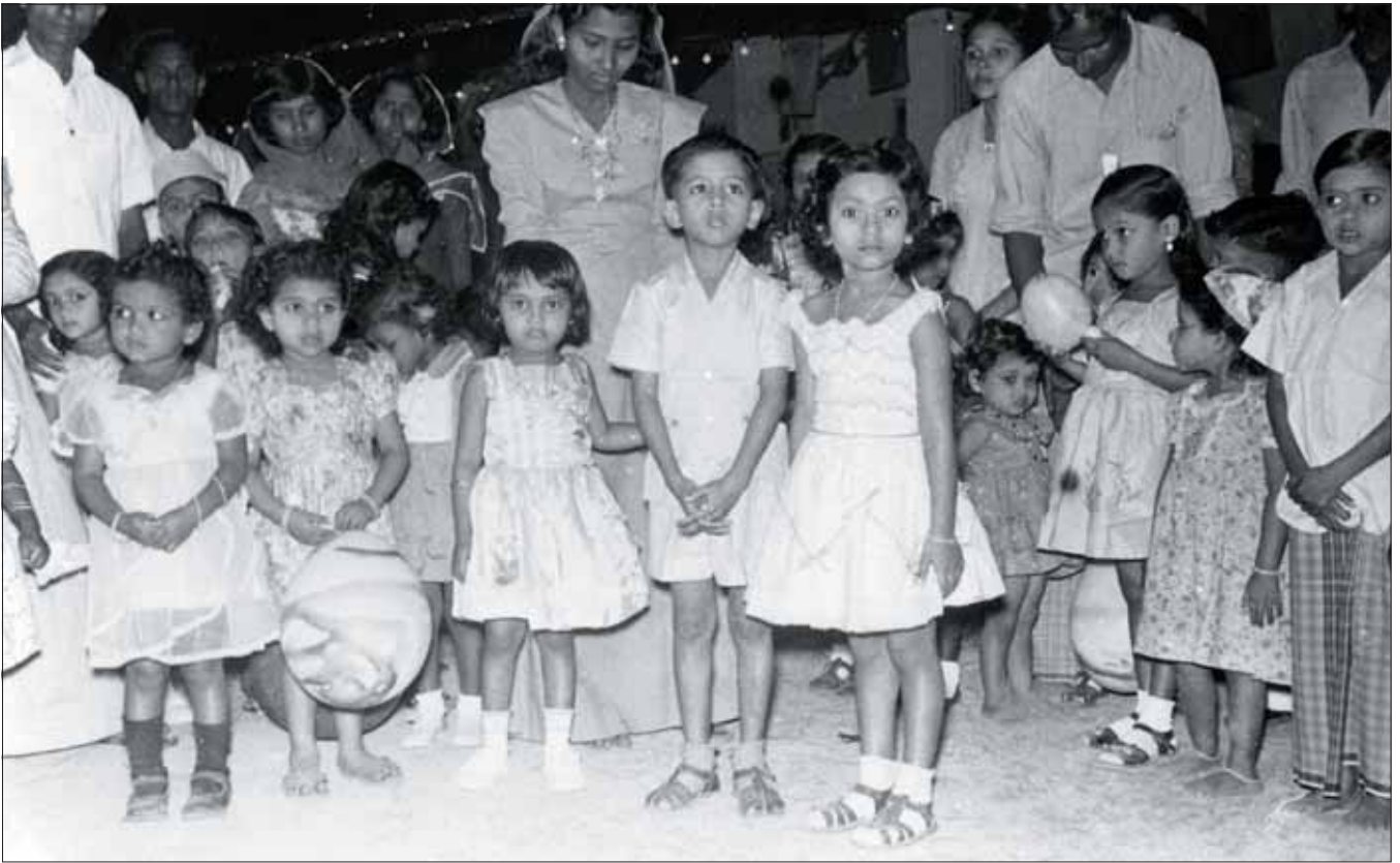
ދިވެހި ބަހުގެ ދަރިވަރުންނަށް ދިނުމަށް ޖަހާ ފަންޖަރު ބޭނުންކުރުމުގެ ގޮތުން ސަލާމް ދެއްވާ ދަރިވަރުން - ސަލާމް ދެއްވާ ދަރިވަރުން - ސަލާމް ދެއްވާ ދަރިވަރުން