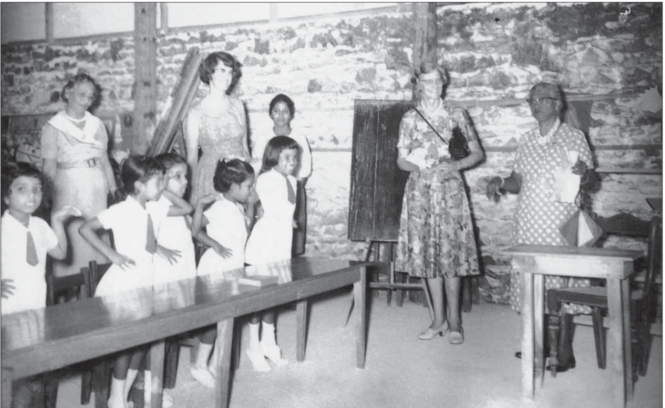
ދިވެހި ބަހުގެ ދަރިވަރުންނަށް ދިނުމަށް ޖަހާ ފަންޖަރު ބޭނުންކުރުމުގެ ގޮތުން ސަލާމް ދެއްވާ ދަރިވަރުން