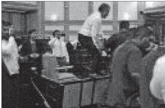
ސަރުކާރުގެ ޖެނެރަލް ސެކްޓަރީ ޖެނެރަލް ގެ ޖެނެރަލް މީޓިންގުގައި ބައިވެރިވަމުން ދިޔައެވެ.

މިއަހަރުގެ ޖެނެރަލް މީޓިންގުގައި ބައިވެރިވަމުން ދިޔައެވެ. ޖެނެރަލް މީޓިންގުގެ ސަބަބުން ސަރުކާރުގެ ޖެނެރަލް ސެކްޓަރީ ޖެނެރަލް ގެ ޖެނެރަލް މީޓިންގުގައި ބައިވެރިވަމުން ދިޔައެވެ. ޖެނެރަލް މީޓިންގުގެ ސަބަބުން ސަރުކާރުގެ ޖެނެރަލް ސެކްޓަރީ ޖެނެރަލް ގެ ޖެނެރަލް މީޓިންގުގައި ބައިވެރިވަމުން ދިޔައެވެ. ޖެނެރަލް މީޓިންގުގެ ސަބަބުން ސަރުކާރުގެ ޖެނެރަލް ސެކްޓަރީ ޖެނެރަލް ގެ ޖެނެރަލް މީޓިންގުގައި ބައިވެރިވަމުން ދިޔައެވެ.