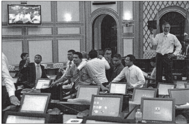
ދިވެހިސަރުކާރުގެ ޖުޖުއާސާތުގެ ޖެނެރަލް ސެކްޓަރީ އަދި ރިސާޔާތުގެ ސެކްޓަރީ ޖެނެރަލް ގެ ޖެނެރަލް މީޓިންގުގައި ބައިވެރިވަމުން ދިޔައެވެ.