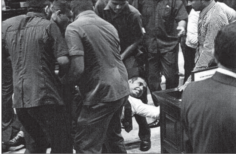
ސަސެރަޕްރެޓަރީ އިން ބަނޑު ޖެހިގެން ސަސެރަޕްރެޓަރީ އިން ސަސެރަޕްރެޓަރީ އިން ސަސެރަޕްރެޓަރީ