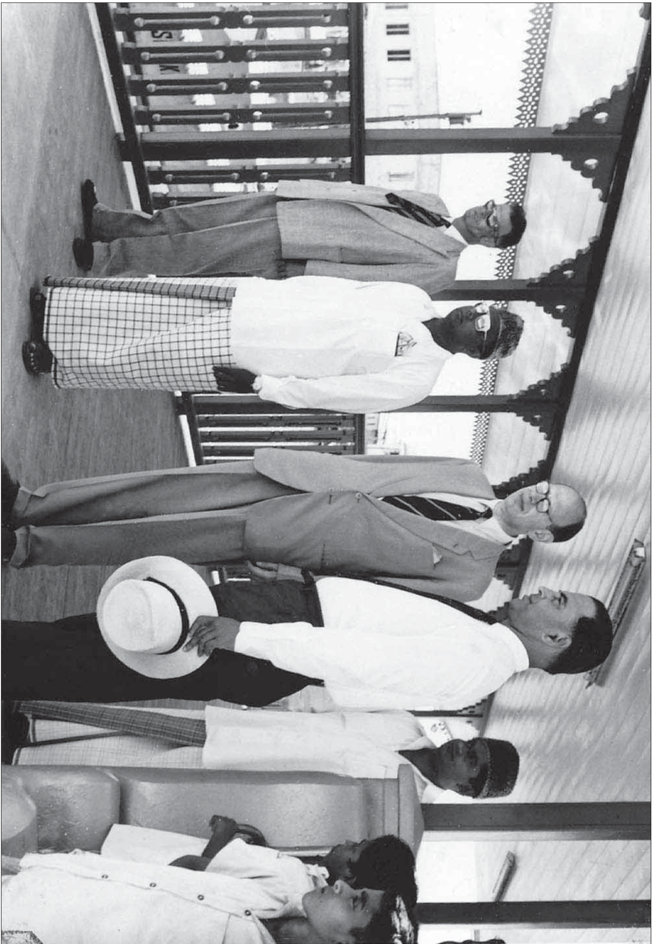
1963 ސަލްޔާން ގެ ސަރުކާރުގެ ފަރާތުން ރާއްޖޭގެ ސަރުކާރުގެ ފަރާތުން ދަތުރުކުރި ބޭފުޅުންގެ ފޮޓޯ - ސަރުކާރުގެ ފަރާތުން ދަތުރުކުރި ބޭފުޅުންގެ ފޮޓޯ - 1963