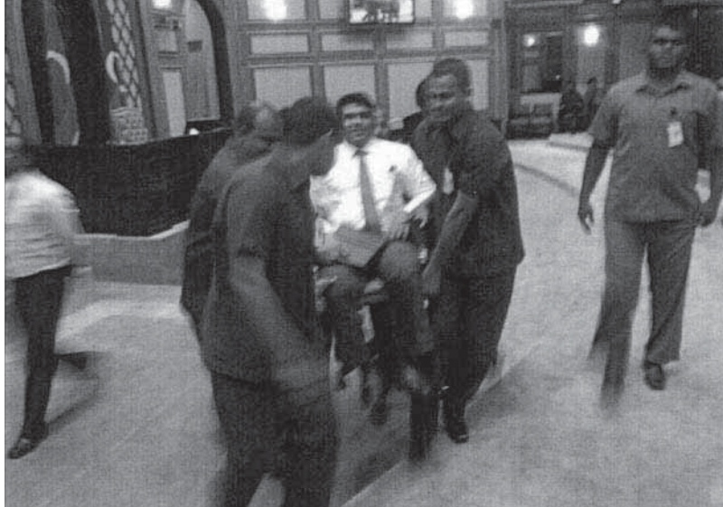
ސަސެރަޕްރެޓަރީ އިން ބަނޑު ޖެހިގެން ސަސެރަޕްރެޓަރީ އިން ސަސެރަޕްރެޓަރީ އިން ސަސެރަޕްރެޓަރީ