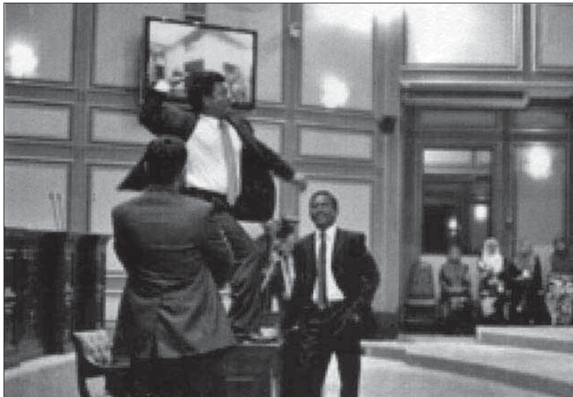
ސަސެރަޕްރެޓަރީ އިން ބަނޑު ޖެހިގެން ސަސެރަޕްރެޓަރީ އިން ސަސެރަޕްރެޓަރީ އިން ސަސެރަޕްރެޓަރީ