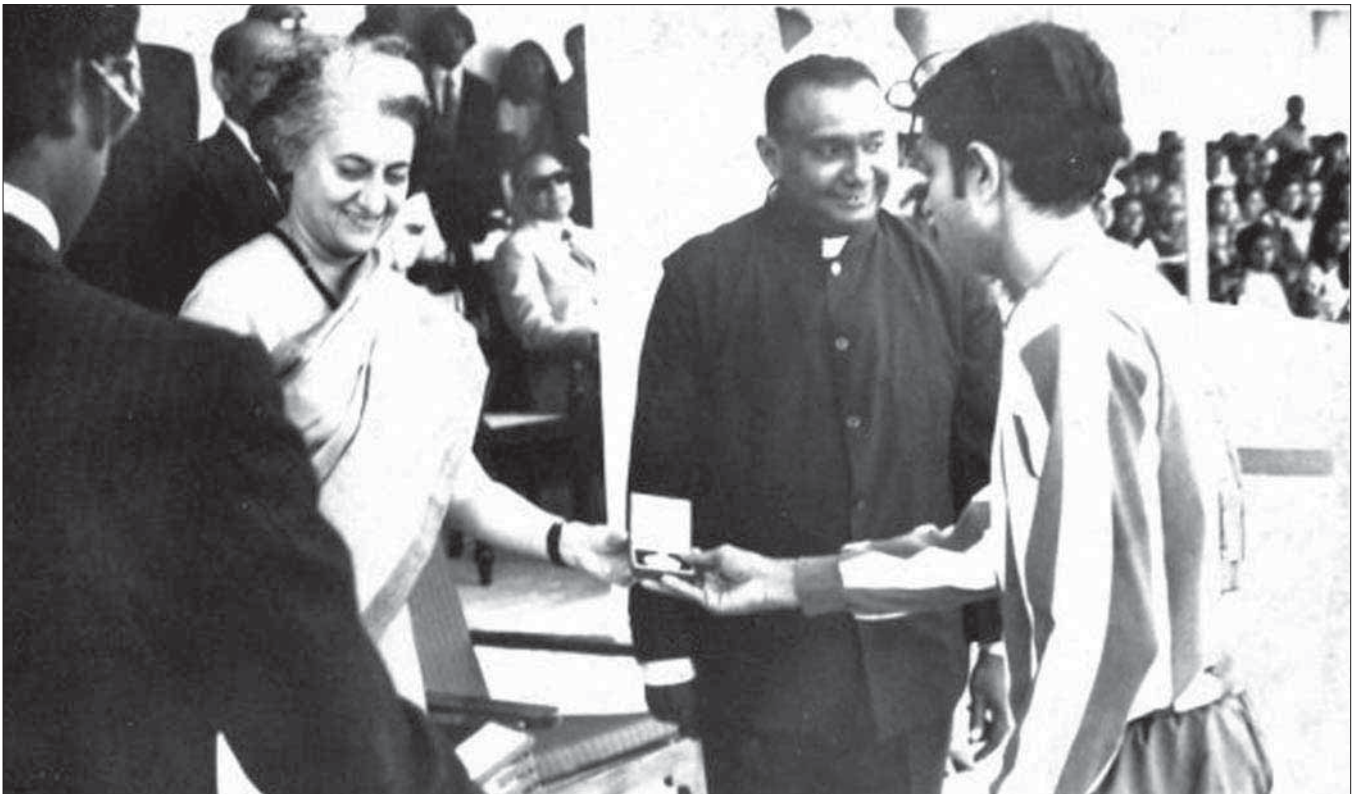
රිසිනේරියන් සමාජ සේවකයන්ගේ සහයෝගීතාවය නිමැවීමේ උදව්වලින් යුක්තව, ප්‍රධාන අධ්‍යක්ෂ ජනරාල් ජී. එන්. සේනාරත්න මහතරු විසින් පුද්ගලිකව ප්‍රවෘත්ති ලේඛණයක් පිරිනැමීම.

සූර්යාස්තයේදී: රිසිනේරියන් සමාජ සේවකයන්ගේ සහයෝගීතාවය නිමැවීමේ උදව්වලින් යුක්තව, ප්‍රධාන අධ්‍යක්ෂ ජනරාල් ජී. එන්. සේනාරත්න මහතරු විසින් පුද්ගලිකව ප්‍රවෘත්ති ලේඛණයක් පිරිනැමීම.