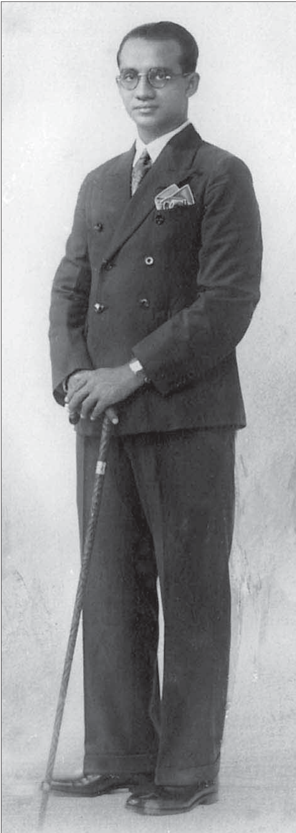
ރަޖިސްޓްރާރު މުޢައްލިމު މުޢައްދި އިދީ ސިޔާސީ ޕާޓީގެ ލީޑަރު ސަރުކާރުގެ ލީޑަރު ސަރުކާރުގެ ލީޑަރު - ރަވަދު ސަރުކާރުގެ ލީޑަރު މުޢައްދި އިދީ ގެ ސަރުކާރުގެ ލީޑަރު ސަރުކާރުގެ ލީޑަރު