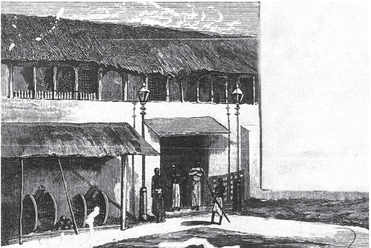
ދިވެހިރާއްޖޭގެ ސަރުކާރުގެ ދަށުން (ފަރާތްތަކުން) ބޭނުންކުރާ ތަރުޞާވާ ތަކެތި