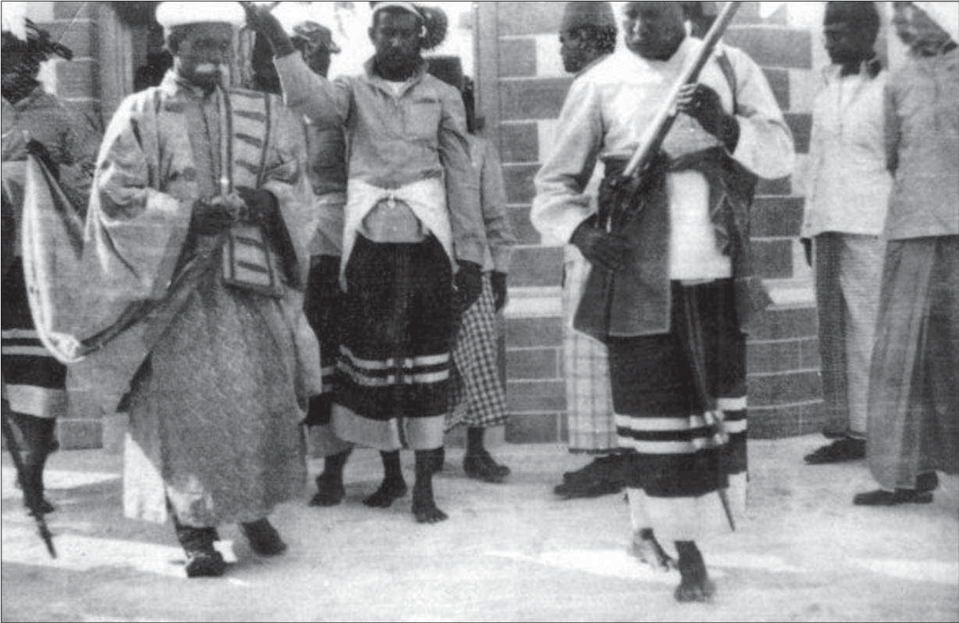
3 ގެ ސަލާމަތީ ބަލަހައްޅައިދޭ ގޮތް ބަލައިލުމަށް ފަހު ސަރުކާރުގެ ފަރާތުން ފަނޑުކޮށްދޭ ފަރާތްތަކުގެ ސަލާމަތީ ބަލަހައްޅައިދޭ ގޮތް

ސަލާމަތީ ބަލަހައްޅައިދޭ ގޮތް ބަލައިލުމަށް ފަހު ސަރުކާރުގެ ފަރާތުން ފަނޑުކޮށްދޭ ފަރާތްތަކުގެ ސަލާމަތީ ބަލަހައްޅައިދޭ ގޮތް 2015 ވަނަ އަހަރުގެ 11- ވަނަ ދުވަހުގެ ރިޕޯޓް (2015) ގައި ބަލައިލެވޭ ގޮތްތަކުގެ ބަލަހައްޅައިދޭ ގޮތް 75