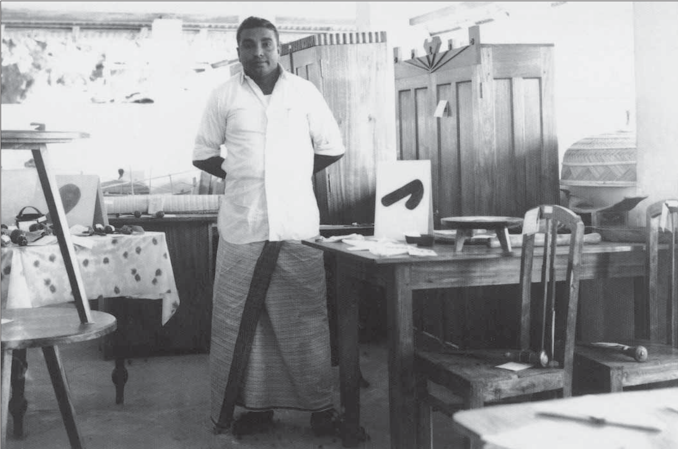
Բարձրագույն կրթության նախարար Եթովպիայի Հանրապետության Լեզուների կոմիտեի

հիշատակային և մանրամասն արձանագրությունները, որոնցով Եթովպիայի հասարակական շրջանները արձանագրեցին իրենց շահերը և հանձնարեցին հարմարություններ 259 հոդվածով ընդունված Եթովպիայի Հանրապետության Հիմնական օրենքի 140-րդ հոդվածի և 141-րդ հոդվածի համաձայնությամբ ընդունված օրենքի հոդվածները կիրառվելու համար, որոնցով ստեղծվել է Եթովպիայի Լեզուների կոմիտեի մասին օրենքի 1-րդ հոդվածի 1-րդ կետի և 2-րդ կետի համաձայնությամբ հաստատված օրենքով ստեղծված «Լեզուների կոմիտեի» կազմակերպությունը և օրենքի 2-րդ կետի համաձայնությամբ ստեղծված և 1-րդ կետի համաձայնությամբ հաստատված «Լեզուների կոմիտեի» կազմակերպության կազմակերպությունը Եթովպիայի Լեզուների կոմիտեի կազմակերպության կազմակերպությունը Եթովպիայի Լեզուների կոմիտեի կազմակերպության կազմակերպությունը Եթովպիայի Լեզուների կոմիտեի կազմակերպության կազմակերպությունը