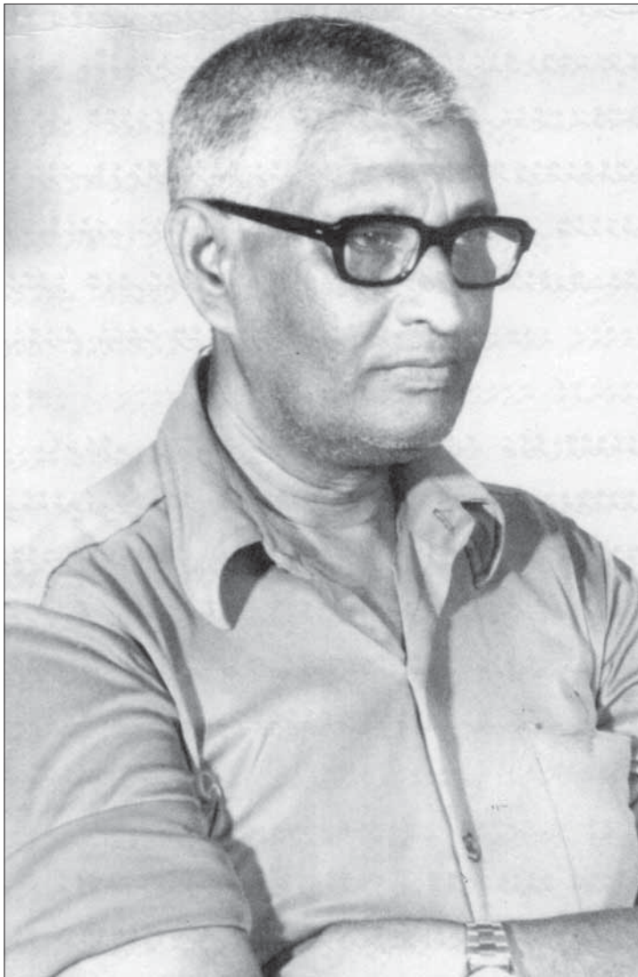
Եր. Գր. - Հայաստանի 100-ամյակի շրջանագիծը

Վերջին 100 տարիների ընթացքում հայաստանում մեծագույն ճանապարհորդություններ են կատարվում, որոնք հանգում են հայաստանի հարյուրամյակի 100-ամյակին, որը հայաստանի պատմության ամենամեծ ժողովրդային շրջանագծերից մեկն է: Վերջին 100 տարիների ընթացքում հայաստանը անկասկածաբար դարձել է աշխարհի մեծագույն շրջանագիծներից մեկը, որն աշխարհի բոլոր ցեղերի միջև կապ է ստեղծում: Վերջին 100 տարիների ընթացքում հայաստանը կորցրել է մեծագույն ժողովրդային շրջանագիծը, որն աշխարհի բոլոր ցեղերի միջև կապ է ստեղծում: Վերջին 100 տարիների ընթացքում հայաստանը կորցրել է մեծագույն ժողովրդային շրջանագիծը, որն աշխարհի բոլոր ցեղերի միջև կապ է ստեղծում: