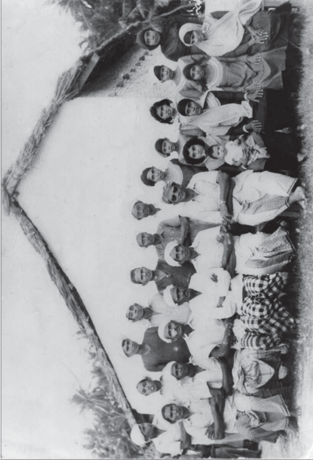
جمہور محمد امین کے قریب واقع ڈیڑھ سو سال پرانے قصبے کے لوگوں کی ایک تصویر، 1953ء اور ان کے بعد کے دوروں میں ڈیڑھ سو سال پرانے قصبے کے لوگوں کی ایک تصویر