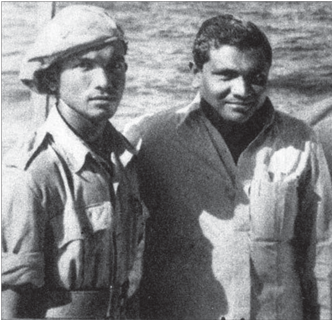
Two men in work clothes and a hard hat, likely at a construction site.

The journal is published by the Dhivehi Language Institute, Maldives. It is a platform for the dissemination of knowledge and information in the Dhivehi language and culture.