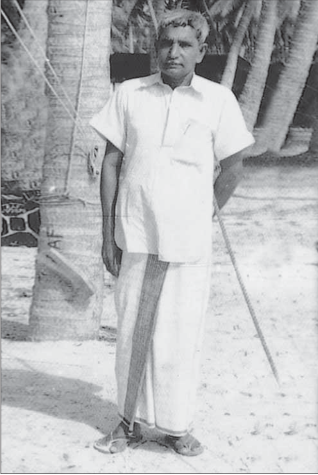
ժողովում Թ. Թ. Թ.