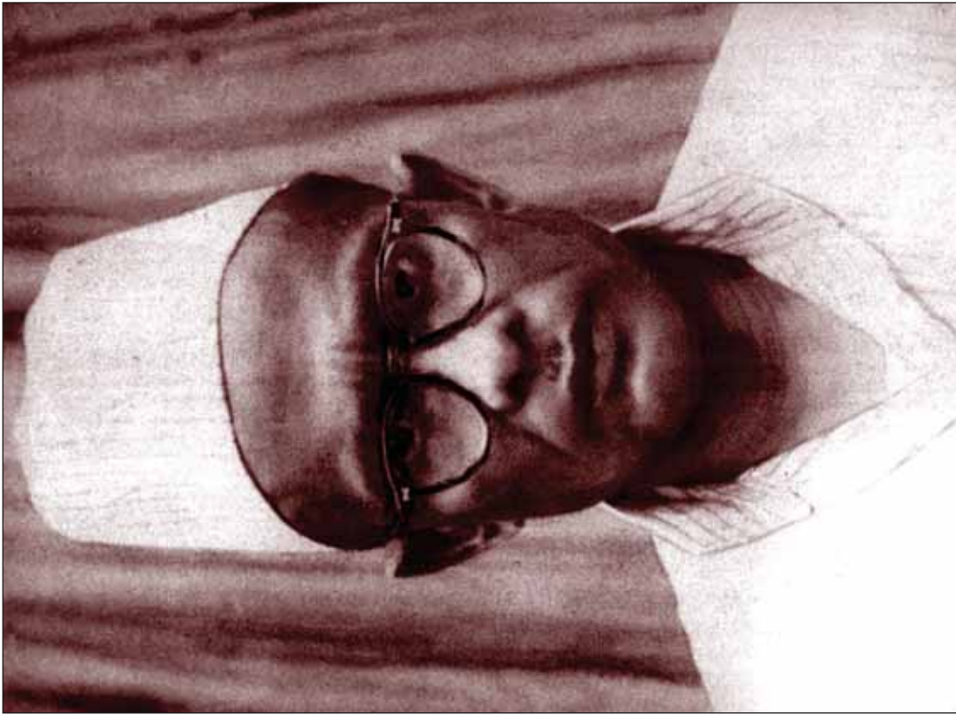
2004 ގަވާއިދުގެ ދަށުން ޖެނެރޭޝަންގެ ރައީސުން ދެކޮޅު ހެދިފައިވާ ކަން ބަޔާންކުރެއްވި ފަރާތްތަކުގެ ފަތުރުކުރުވާ ފަރާތްތަކުގެ ތެރެއިން ޖެނެރޭޝަންގެ ރައީސުން ދެކޮޅު ހެދިފައިވާ ކަން ބަޔާންކުރެއްވި ފަރާތްތަކުގެ ފަތުރުކުރުވާ ފަރާތްތަކުގެ ތެރެއިން

2004 ގަވާއިދުގެ ދަށުން ޖެނެރޭޝަންގެ ރައީސުން ދެކޮޅު ހެދިފައިވާ ކަން ބަޔާންކުރެއްވި ފަރާތްތަކުގެ ފަތުރުކުރުވާ ފަރާތްތަކުގެ ތެރެއިން ޖެނެރޭޝަންގެ ރައީސުން ދެކޮޅު ހެދިފައިވާ ކަން ބަޔާންކުރެއްވި ފަރާތްތަކުގެ ފަތުރުކުރުވާ ފަރާތްތަކުގެ ތެރެއިން ޖެނެރޭޝަންގެ ރައީސުން ދެކޮޅު ހެދިފައިވާ ކަން ބަޔާންކުރެއްވި ފަރާތްތަކުގެ ފަތުރުކުރުވާ ފަރާތްތަކުގެ ތެރެއިން