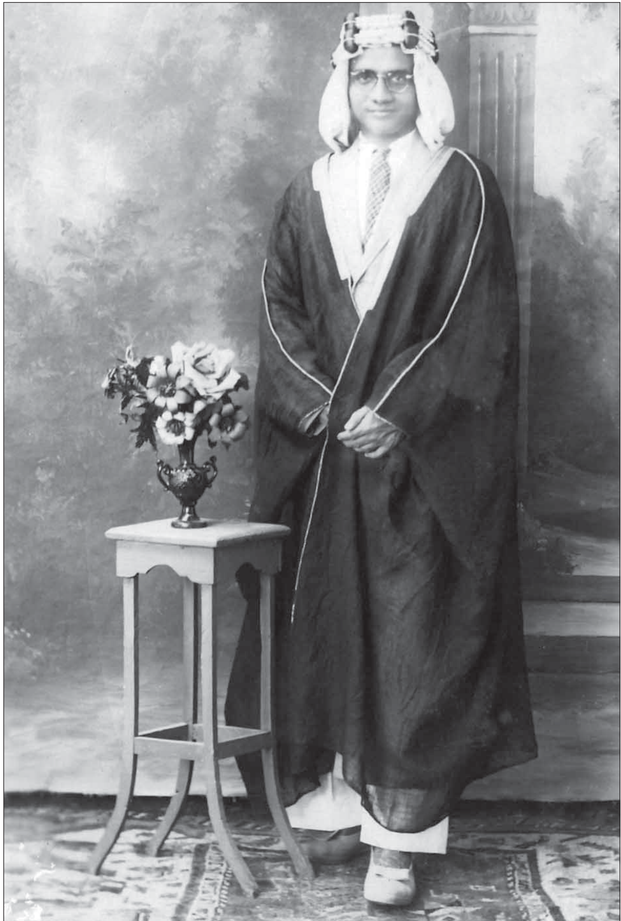
ދިވެހިރާއްޖޭގެ ފުރުޞަތުގެ ދަރިވަރުންގެ ދަތުރު ދުވަސް 2015 ވަނަ އަދަދުގެ ދަތުރު ދުވަހުގެ ތާރީޚު 2015 ވަނަ އަދަދުގެ ދަތުރު ދުވަހުގެ ތާރީޚު