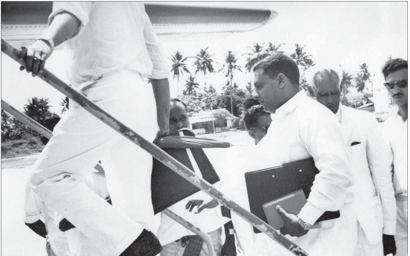
විද්‍යා ප්‍රවෘත්ති සංචාරයක් සඳහා 55 වන වාර්තාවක් සිසුන් සහ 56 වන වාර්තාවක් සිසුන් සඳහා සකස් කළේය.

විද්‍යා ප්‍රවෘත්ති සංචාරයක් සඳහා 55 වන වාර්තාවක් සිසුන් සහ 56 වන වාර්තාවක් සිසුන් සඳහා සකස් කළේය. මෙහිදී සිසුන් විද්‍යා ප්‍රවෘත්ති සංචාරය විස්තරයෙන් සඳහන් කර ඇත. මෙහිදී සිසුන් විද්‍යා ප්‍රවෘත්ති සංචාරයක් සඳහා 55 වන වාර්තාවක් සිසුන් සහ 56 වන වාර්තාවක් සිසුන් සඳහා සකස් කළේය.