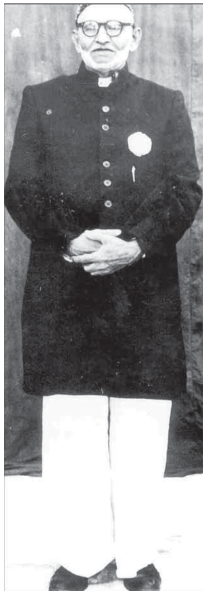
ಸ್ರಿಯೆಟ್ ಬ್ರಸೆನ್ ಕೋಸ್ (ಸ್ರಿಯೆಟ್ ಬ್ರಸೆನ್ ನಾಯಕ್‌ನಿ)