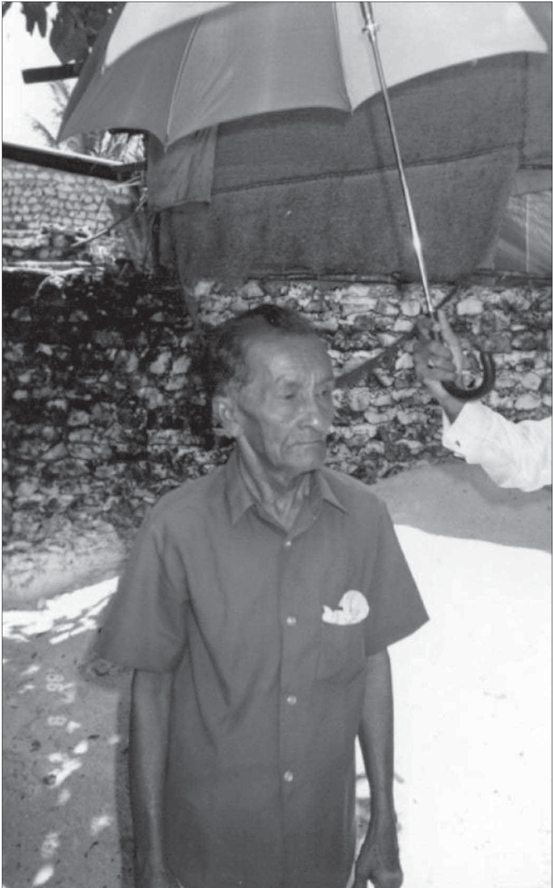
ދިވެހިސަރުކާރުގެ ގެޒެޓްގައި ބަޔާންކުރި ޕްރޮފެޝަރ ޖެޖްމީ ޕްރިންސަލްގެ ފޮޓޯ