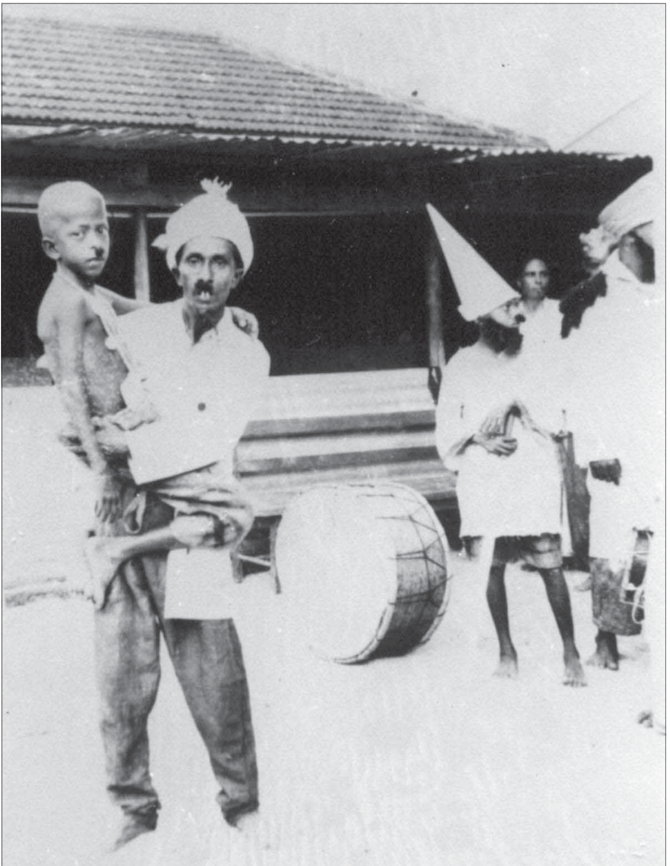
ދިވެހިސަރުކާރުގެ ލަފާއެއް ދެކުނު ޖަލްޞާޒު ޖަނަވާރު ތަޔާރުކުރަން ހަދާ ބޭފުޅުންގެ ވަޑައިގެން ބަލަން ހުންނަ ފޮޓޯ އެކުލަވާލެއްކެވެ. ދިވެހިސަރުކާރުގެ ލަފާއެއް ދެކުނު ޖަލްޞާޒު ޖަނަވާރު ތަޔާރުކުރަން ހަދާ ބޭފުޅުންގެ ވަޑައިގެން ބަލަން ހުންނަ ފޮޓޯ އެކުލަވާލެއްކެވެ.