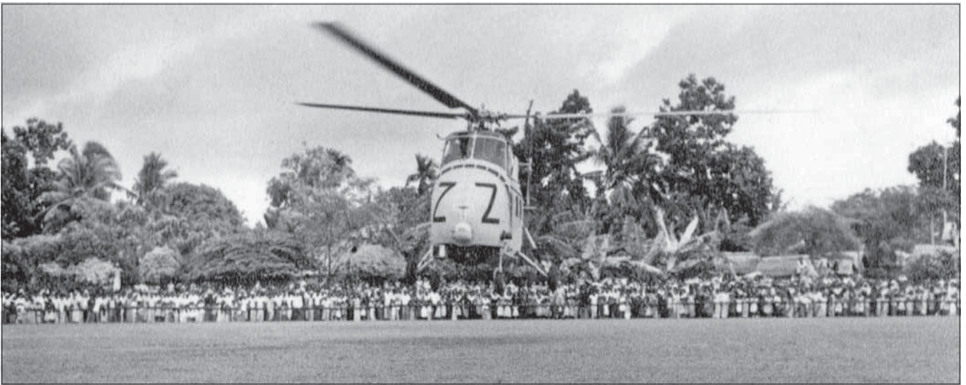
රජයේ ගුවන් යානයක් පැහැර දීම - 2014 ජනවාරි මාසයේ දී