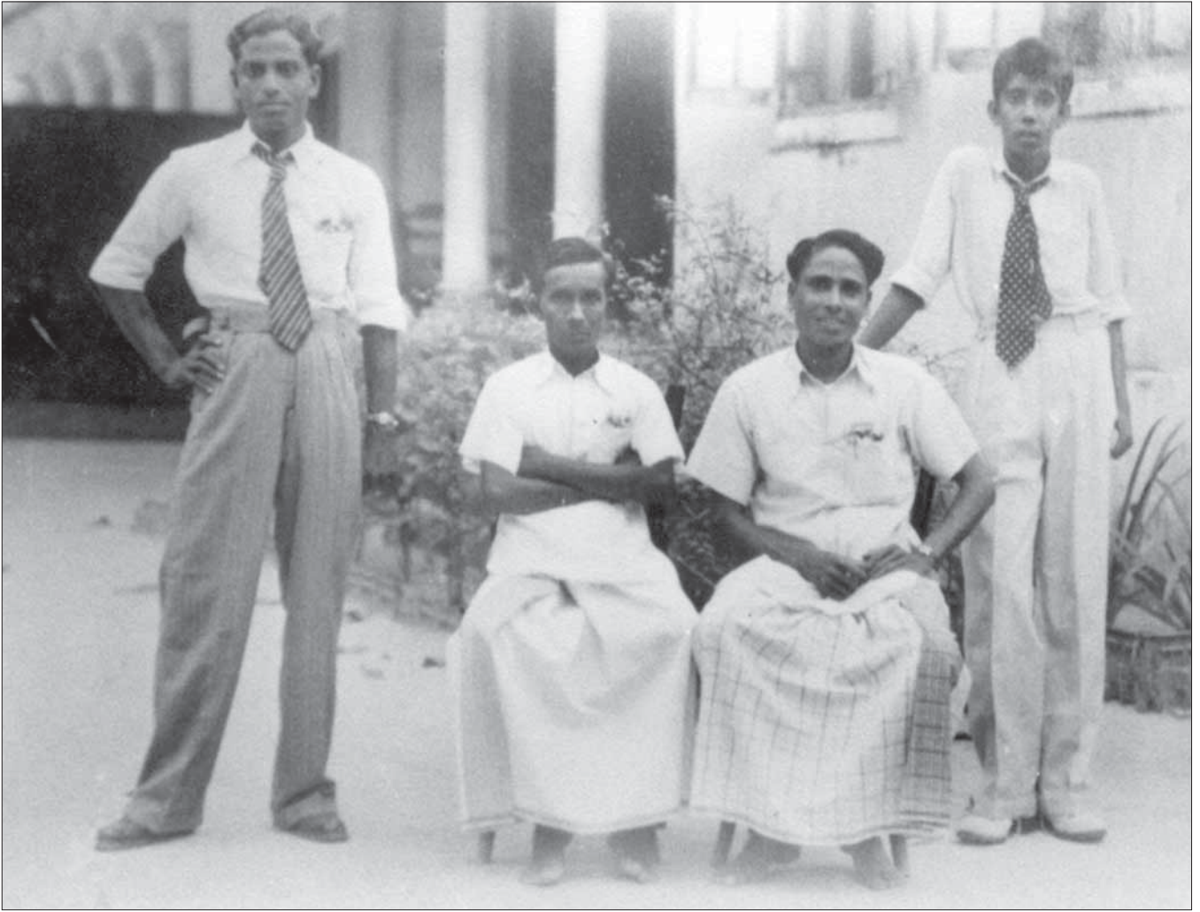
සමූහයේ සාමාජිකයන්ගේ සමූහයක්

සමූහයේ සාමාජිකයන්ගේ සමූහයක්, ජාතික සංවිධානයක් ලෙස පිහිටුවීමට පටන් ගත් අතර, එහි ප්‍රධාන අරමුණ වූයේ සමාජ සේවය සහ සංස්කෘතික වැඩසටහන් ක්‍රියාත්මක කිරීමයි. මෙහි සාමාජිකයන්ගේ අතරමගීත්වය, සමාජ සේවය සහ සංස්කෘතික වැඩසටහන් ක්‍රියාත්මක කිරීමට දායක වීමට ඉඩ සලසා ඇත. මෙහි සාමාජිකයන්ගේ අතරමගීත්වය, සමාජ සේවය සහ සංස්කෘතික වැඩසටහන් ක්‍රියාත්මක කිරීමට දායක වීමට ඉඩ සලසා ඇත.