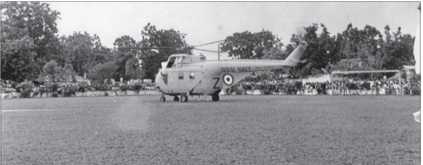
රජයේ ගුවන් යානයක් පැහැර දීම - 2014 ජනවාරි මාසයේ දී

කොටස් රුපියල් මිලියන 100 ක් පමණ වටිනාකමක් ඇති අතර මෙම ගුවන් යානය නිවැරදිව පැහැර දීමට ඉඩ හැරීමට ආණ්ඩුවට සිදුවූ හානිය මිලියන 100 ක් පමණ වේ. මෙම ගුවන් යානය පැහැර දීමට හේතු වූයේ මෙම ගුවන් යානයේ මෙහෙයුම් කළමනාකරුන්ගේ දුර්වලතාවයයි. මෙම ගුවන් යානය පැහැර දීමට හේතු වූයේ මෙම ගුවන් යානයේ මෙහෙයුම් කළමනාකරුන්ගේ දුර්වලතාවයයි.