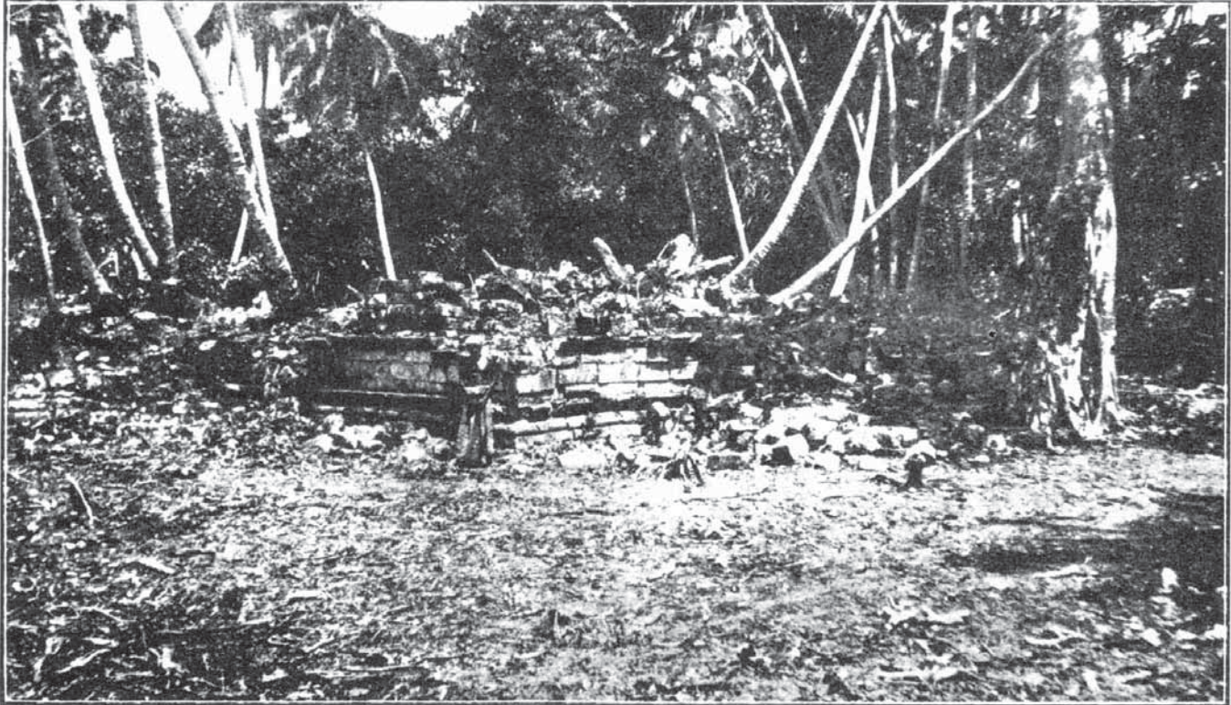
29.—PIRIVEŅA (CLEARED) ; SOUTH-EAST VIEW.