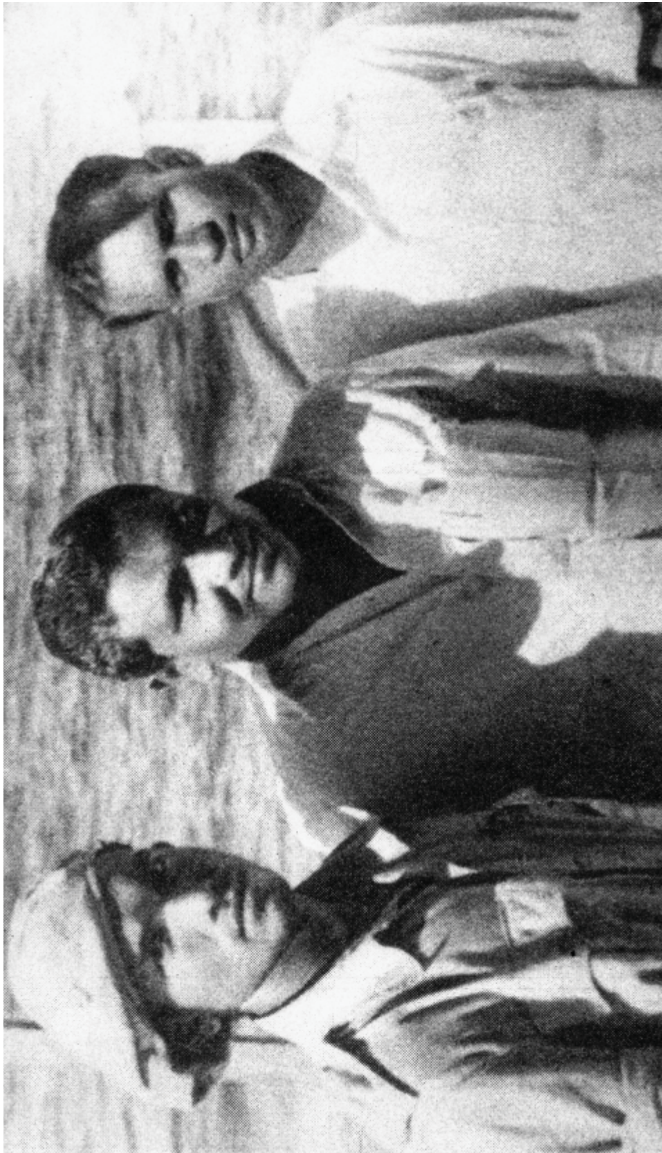
މިފޮތުގައި ބަޔާންކުރި ފޮތްތަކުގެ ފޮތްތަކުގެ ނަންބަރު - ދިވެހި ރާއްޖޭގެ ބަޔާން (16) - 1950 ވަނަ އަދި 17 (17) ވަނަ އަދި 1959 ވަނަ އަދި 2009 ވަނަ އަދި 2016 ވަނަ އަދި 2017 ވަނަ