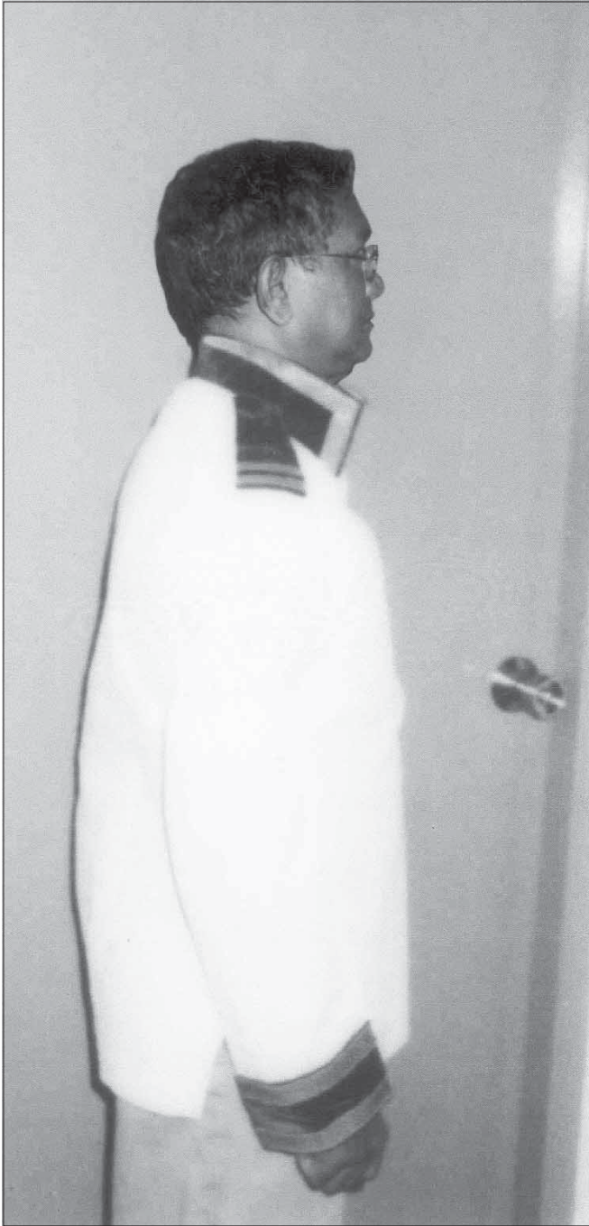
עליהם השם כבודו